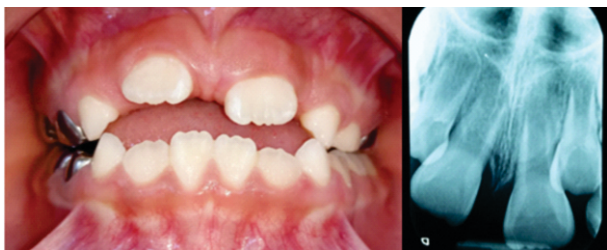
Figura 4. Fotografía final a las 5 semanas. Radiografía periapical después de 5 semanas de realizada la cirugía.