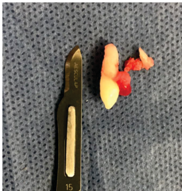
Figura 3. Diente supernumerario extraído.